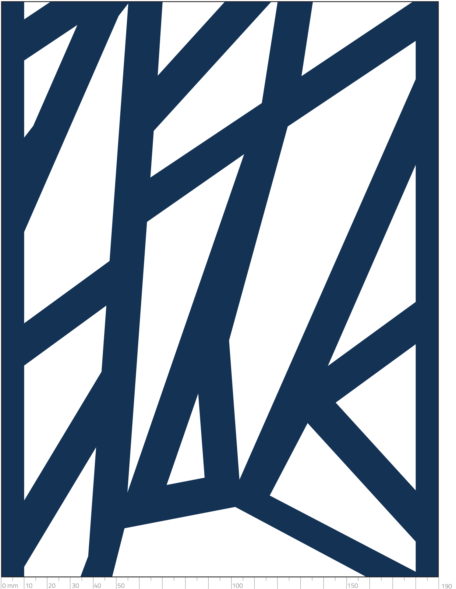
Vzorek plechu RYTHMIC CORAIL – výřez na formátu A4 v měřítku 1:1